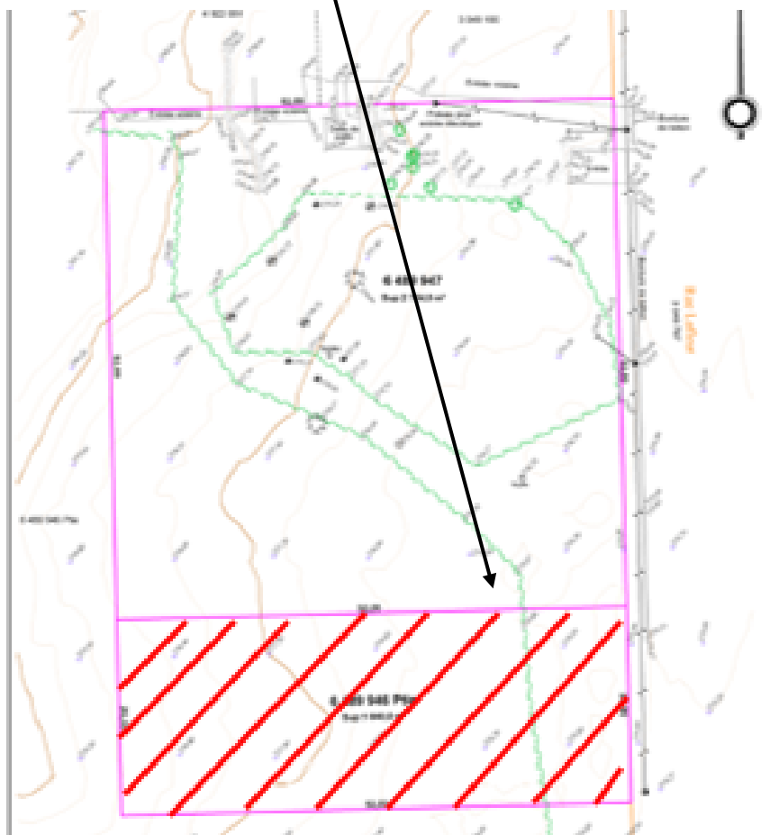
Section hachurée à ajouter à la zone H-621