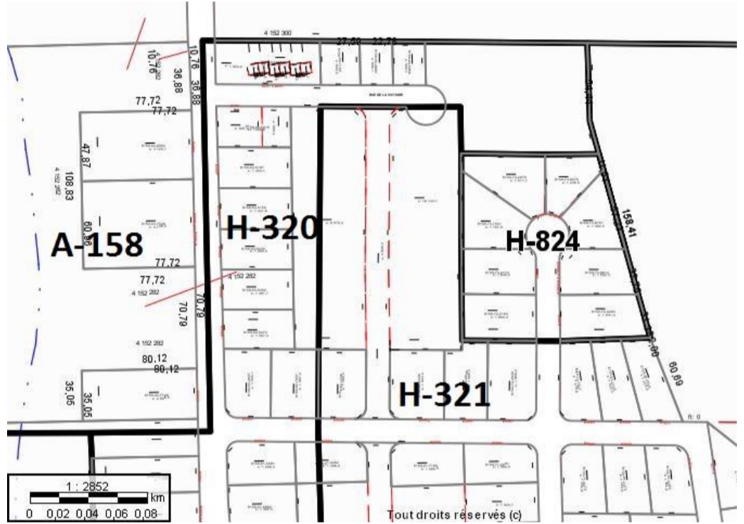
Avant les modifications