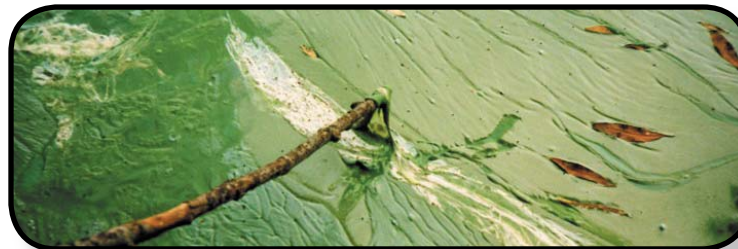
Fleur d'eau de cyanobactéries.