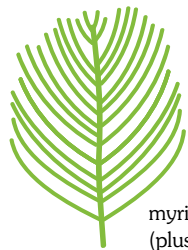
myriophylle à épi (plus de 12 segments)

L'espèce se distingue d'un myriophylle indigène, appelé myriophylle blanchissant ( Myriophyllum sibiricum ), par le nombre de segments de chaque côté de la feuille qui a l'apparence d'une plume. Le myriophylle à épi possède plus de 12 segments alors que le myriophylle indigène en possède moins de 11 (voir dessin). De plus, les feuilles du myriophylle à épi sont souvent tronquées à leur partie supérieure.