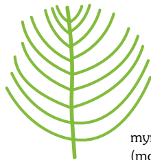
myriophylle indigène (moins de 11 segments)